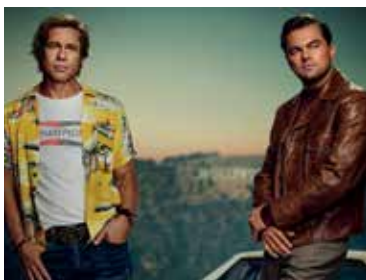
Once Upon a Time... in Hollywood © Sony Pictures Releasing

Eintritt: € 1,50 + aka-Mitgliedsausweis (€ 3 pro Semester) oder CSH-Mitgliedsausweis